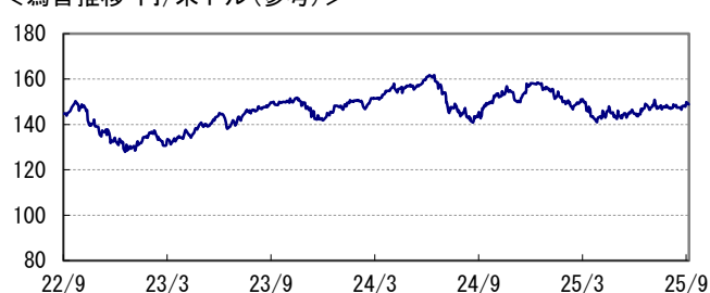
＜為替推移 円/米ドル(参考)＞

※当レポート中の各数値は四捨五入して表示している場合がありますので、それを用いて計算すると誤差が生じることがあります。